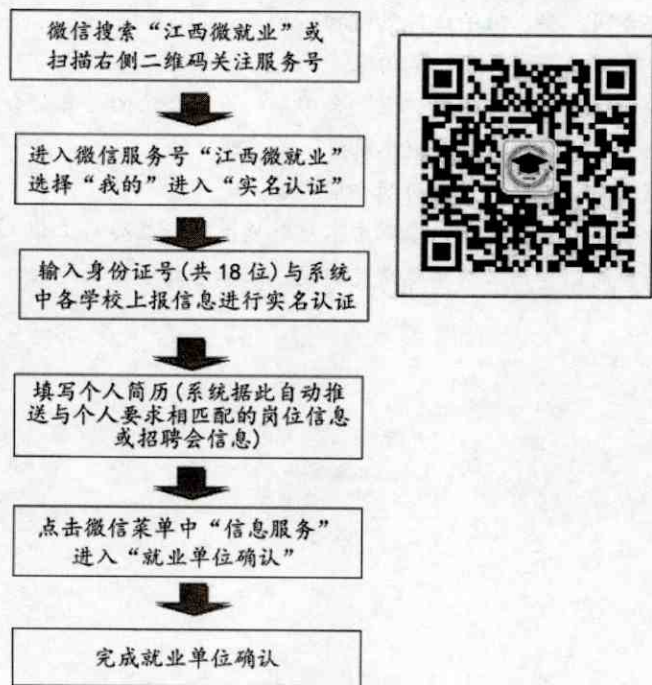
毕业生在微信端进行就业状况实名制查询校对流程图

《江西省普通高、中等学校毕业生就业协议书》一式三份，其中毕业学校、毕业生、用人单位各一份，每份协议书有固定编号，要妥善保管，复制、转借、挪用均无效。就业协议书实名确认微信服务号“江西微就业”端使用流程如下：